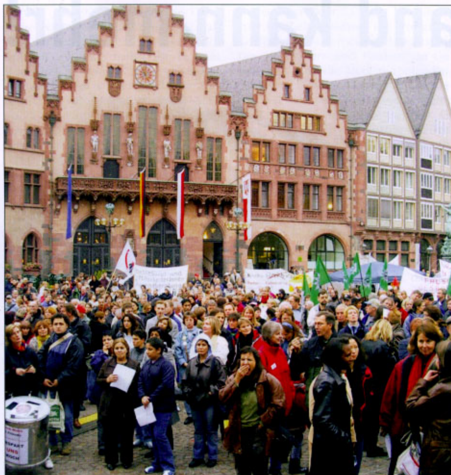
Aktion der Arbeitslosen: Montagsdemo in Frankfurt gegen Sozialabbau